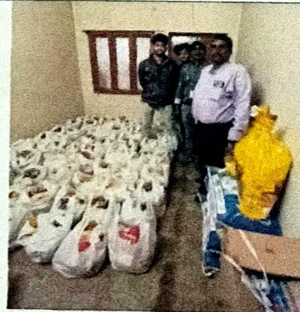
Rice, Dal, Nutritious Food for the HIV Positive